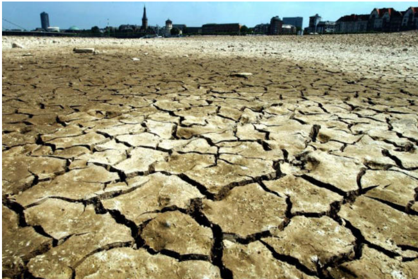
Abb. 3 / "Aufgerissene Erde im ausgetrockneten Rheinufer bei Düsseldorf, Mitte Juli 2003." Süddeutsche Zeitung (Foto: dpa)