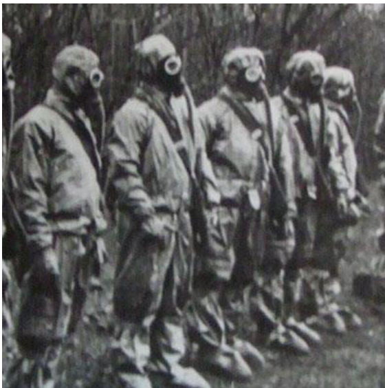
Abb. 1 / Liquidatoren

Um Containment bemüht sendet die sowjetische Staatsführung sogenannte Liquidatoren aus (siehe Abb. 1). Sie bekommen den Auftrag jegliche Spur zu beseitigen, das Unglück geradezu ungeschehen zu machen. Dem neuen Jimmy gelingt es jedoch, der Liquidation zu entgehen und in die weite Welt zu entweichen.