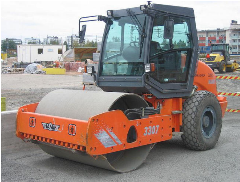
Abb. 5 / Walzenzug mit Glattmantelbandage (public domain)