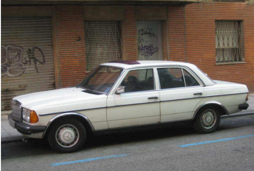
Abb. 6 / Mercedes Benz 200 W123