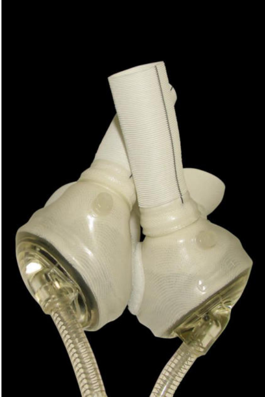
Abb. 7 / Kunstherz