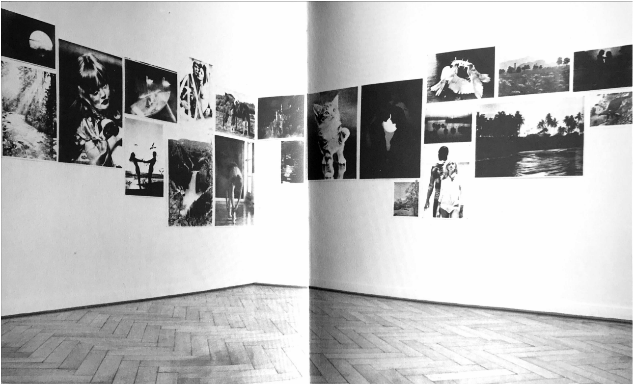
Abb. 1: Hans-Peter Feldmann, Sonntagsmotive , 1976-77, 21 Offset- und Siebdruck Plakate, verschiedene Formate, Galerie Paul Maenz, Köln.

Gezeigt werden typische Motive der 1970er-Jahre, die trotz Abstrahierung durch Siebdruck und Reduktion der Farben auf schwarz-weiß weiterhin verführerisch wirken und als Sammlung von Kategorien der Populärkultur verstanden werden können 4 .