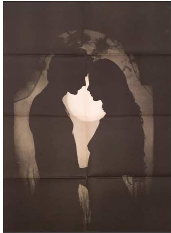
Abb. 4: Caspar David Friedrich, Gartenlaube , 1818, Öl/Lw., 30 x 21,5 cm, Bayerische Staatsgemäldesammlungen/Neue Pinakothek München. Abb. 5: Hans-Peter Feldmann, Ohne Titel [Mann und Frau: Silhouette] , 1976, Siebdruck/Papier, 86,5 x 61,5 cm, Sammlung Fotomuseum Winterthur.

Hiermit vergleichen lässt sich auch das Bild „Paar am Strand“ aus den „Sonntagsmotiven“. Allerdings ist das Paar hier in der Totale zu sehen. Dieses Bild wird gerahmt von Ästen, die die Szene rechts und links abschließen. Anstatt des Mondes ist auf diesem Foto die Sonne zwischen den beiden zu sehen, wie sie gerade am Horizont verschwindet, was wiederum als romantisches Symbol zu deuten ist. Auch hier deuten alle Motive wie Meer, Sonnenuntergang, Nacktheit, Abgeschlossenheit und Natürlichkeit auf Romantik hin. In einer paradiesischen Szene wird das Paar eins mit der Natur. Die Nacktheit kann in diesem Zusammenhang ein Symbol für Ursprünglichkeit, Unschuld und eine unverfälschte Lebensweise sein. Ein ähnliches Sujet weist das Bild „Händehaltendes Paar, Möwen“ auf. Auch hier sind die Personen nur als Silhouetten erkennbar. Allerdings ist das Bild im gesamten heller und bewegter, da sowohl das Paar als auch die Möwen in Bewegung sind.