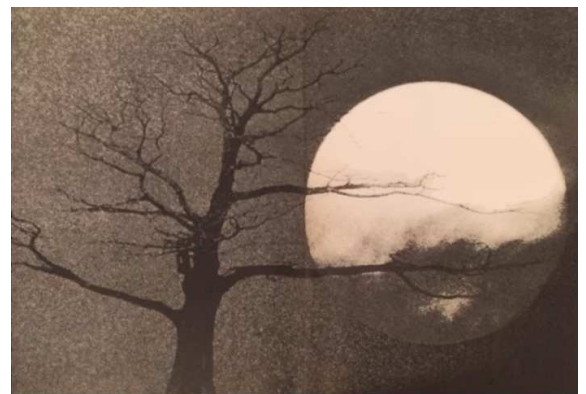
Abb. 2: Caspar David Friedrich, Two Men Contemplating the Moon , 1819-20, Öl/Lw., 35 x 44 cm, Gemäldegalerie, Dresden.